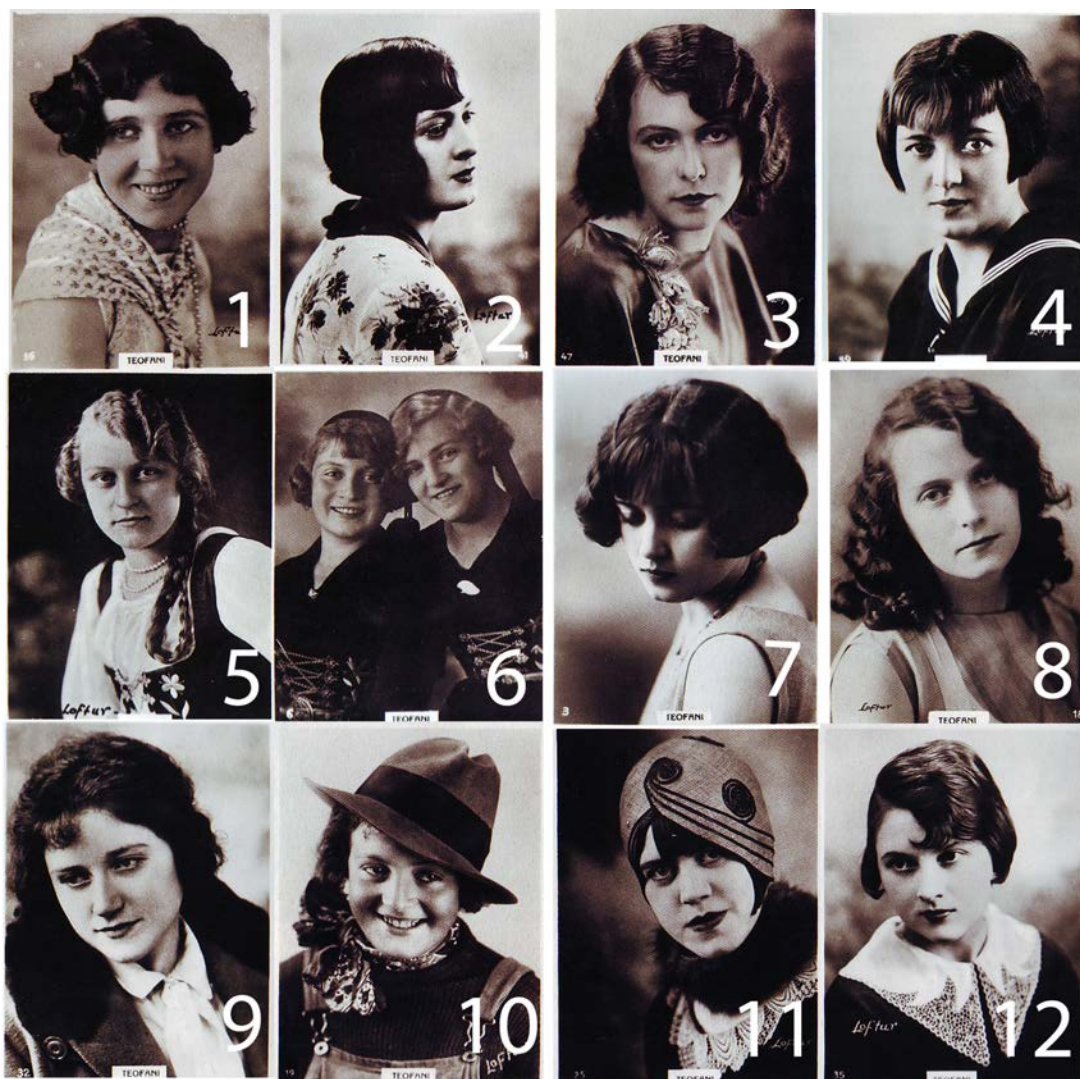
Mynd 4 Nokkrar af teofanistúlkunum

þær í dag, þar sem kynþokkinn skiptir miklu. Strákalega klippingin var allsráðandi á þessum tíma og kannski þóttu matrósafötin passa við hana.