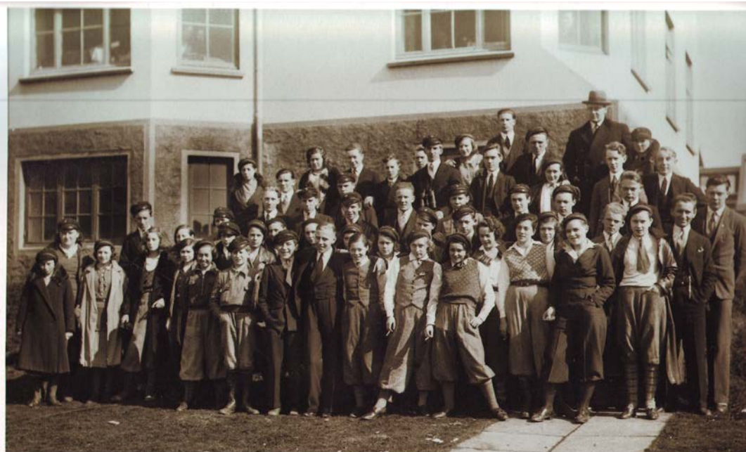
Mynd 6 Verslunarskólanemar

Fljótt á litið mætti halda að þetta væru bara drengir en svo er ekki. Þarna eru stúlkur í fremstu röðinni. Þær klæða sig eins og karlmenn, eru í síðbuxum, skyrtu og vesti, með bindi, í strákaskóm og með hatt. Þessi klæðnaður bendir til þess að „drengraklæðnaður“ hafi verið byrjaður að ryðja sér til rúms á Íslandi um 1930, a.m.k. meðal unglingsstúlkna. Þriðji áratugurinn er kannski sá áratugur þegar unglingar setja einnig svip sinn á tískuna og unglíngamenning er að verða til. Á myndinni eru nokkrar stúlkur sem halda á sígrettu. Þegar rýnt er betur í myndina eru stúlkurnar mun meira áberandi en