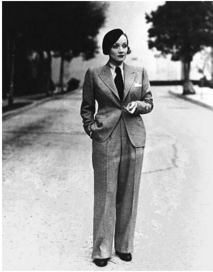
Mynd 7 Marlene Dietrich

strákarnir. Þær standa sumar hverjar í ýktum stellingum og sposkar á svip. Þær eru þær einu sem halda á sígarettum. Það er eins og þær séu að ýkja útlitið og vera