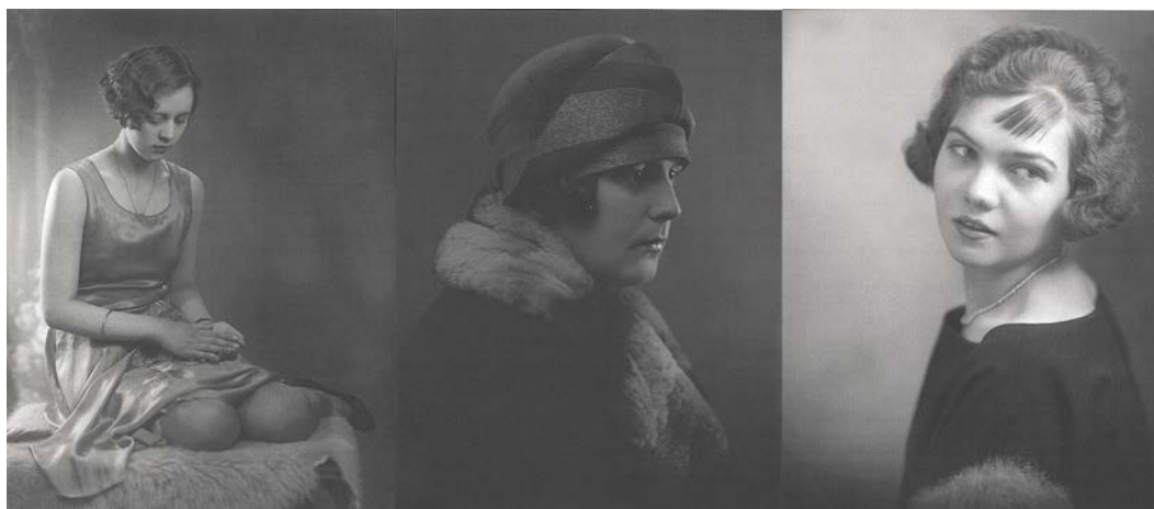
Mynd 9