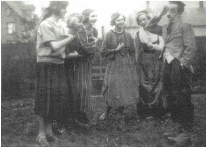
Mynd 3 „Íslandssjapplín“ Úr ævintýri Jóns og Gvendar frá 1923

„Í Reykjavík kom filmið í stað ótal hluta sem aðrar þjóðir áttu fyrir [...] og var stærsti glugginn sem sneri að heimsmenningunni. Þar fann „Reykjavíkurstúlkan“ helstu fyrirmyndir sínar“. 21