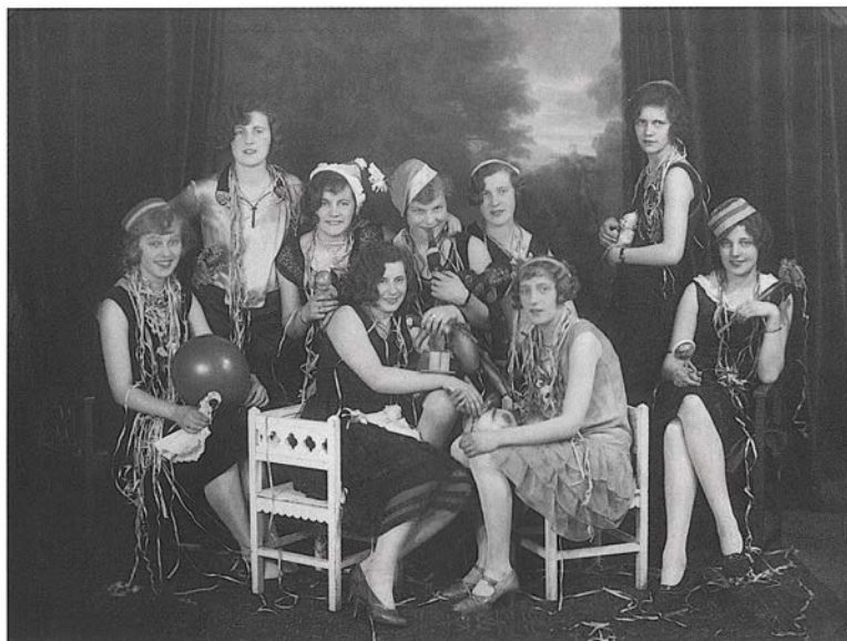
Mynd 8 Reykjavíkurstúlkur 1927

Myndin gæti verið tekin í áramótapartý hjá vinkonum. Eins og fram hefur komið styttust pilsin smám saman á þriðja