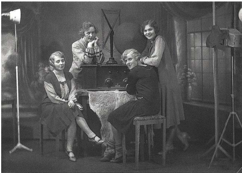
Mynd 1 Radióauglýsing 1927

Í karlmenn, sem gátu ekki setið á sér að skrifa um þetta í blöðin. Þeir skrifuðu meðal annars að það sæmdi ekki siðuðu fólki að vera málað eins og villimenn. Með árunum styttust pilsin enn og 1925 náðu þau rétt niður fyrir hné, eins og sést á myndinni hér að ofan sem var tekin 1927. Hálsmálið á kjólunum var einnig flegnara og konur voru byrjaðar að ganga í þunnum sokkum. Áfram héldu blöðin að fjalla um háttarlag kvenna. „Verkin sýna merkin, [...] „Nábleikt andlit, hryggskekkja, sífelldur lasleiki, blóðleysi og tæringarvottur.” Nei þá voru gömlu góðu vaðmálsfötin betri.” 11