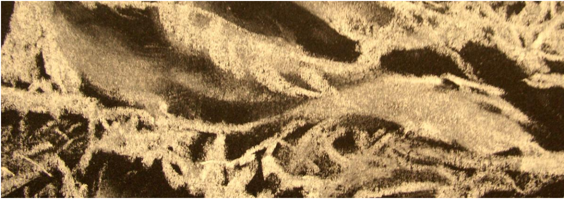
Hluti úr verki nemanda Þ.S. í teikningu í Myndlistask. í R. veturinn 2006-7