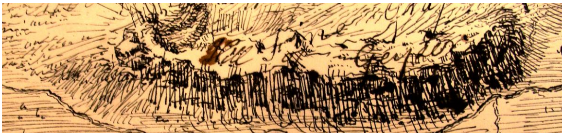
hluti úr teikningu John Baine 1789

Þvert á tíma, tísku og tækni, heldur teikning gildi sínu sem grundvallartæki/tækni til athugunar á umhverfi mannsins og til milliliðalausrar miðlunar/tjáningar á þeirri athugun.