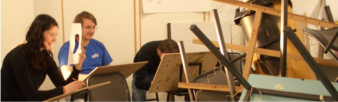
nemendur Þ.S. í teikningu, Fornám skólaárið 2006-7