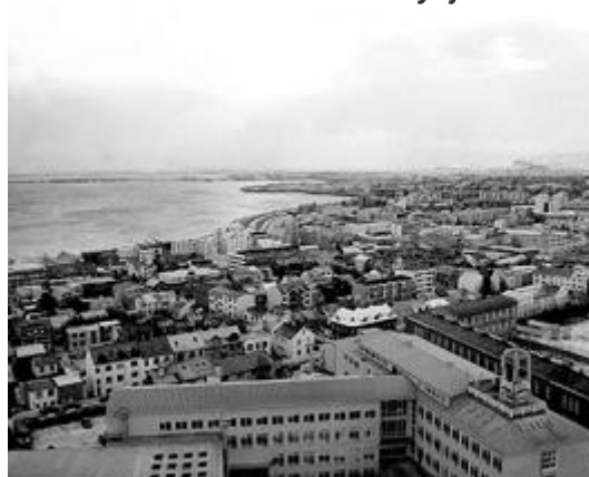
Veduta della baia di Reykjavik

Attualmente il paese sta ancora pagando dazio alla recessione globale. Una novità positiva che la crisi ha portato per l'Islanda è stato l'avvio dei negoziati di ammissione all'Unione Europea, novità che se andrà in porto, renderà l'isola più vicina al continente.