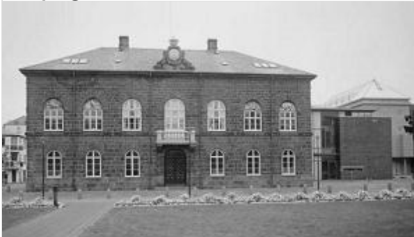
L' Alþingishús dove ha sede il Parlamento