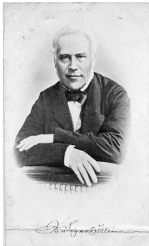
Ritratto di Jón Sigurðsson

Nel 1871 il Parlamento danese approvò unilateralmente una legge che dichiarava l'Islanda una parte inseparabile del Regno di Danimarca, la quale tuttavia poteva godere di qualche privilegio in materia di autogoverno. Questa legge era chiamata "legge di Stato".