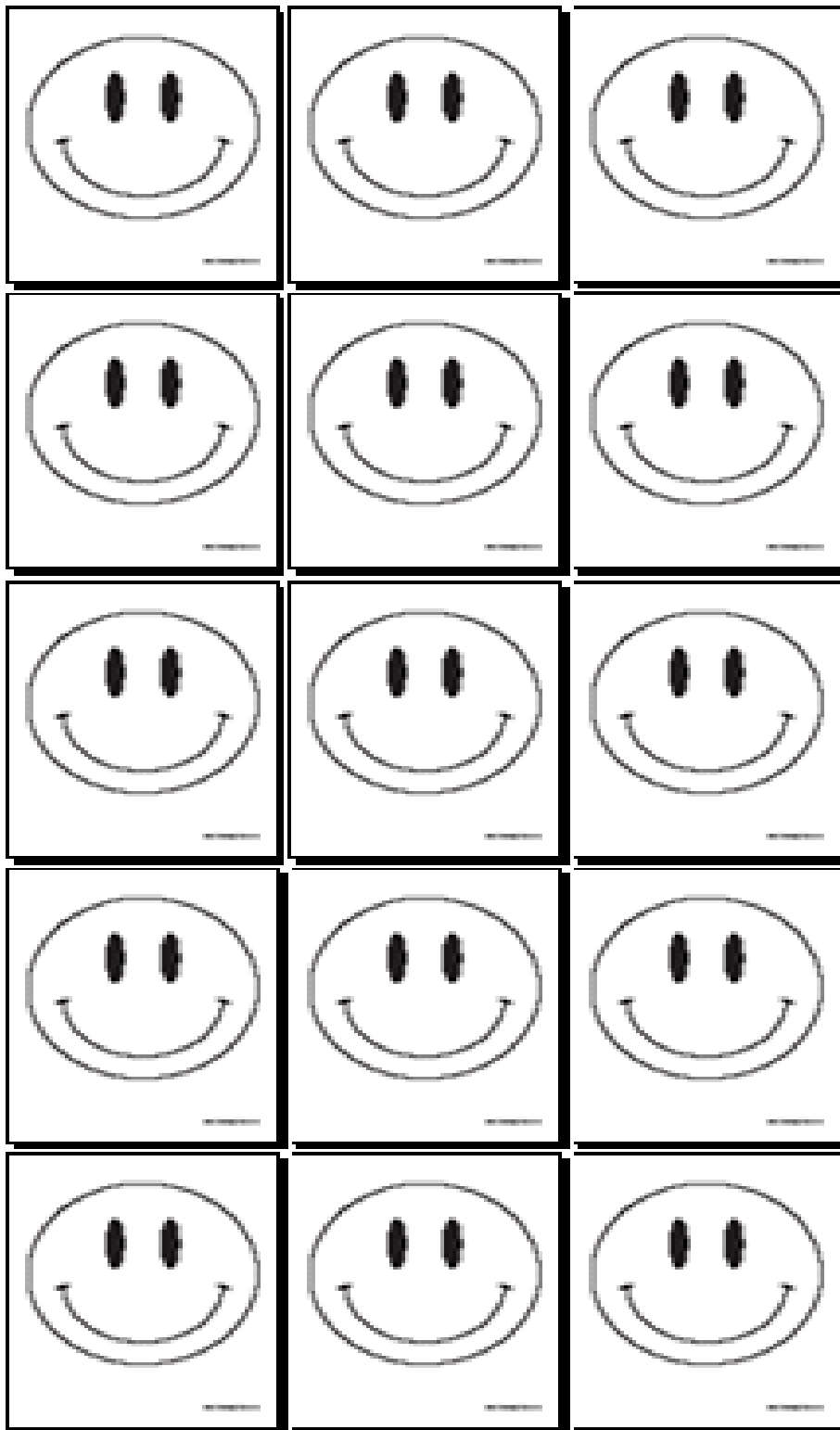
Mynd 2: (Smiley Face Coloring Pages)