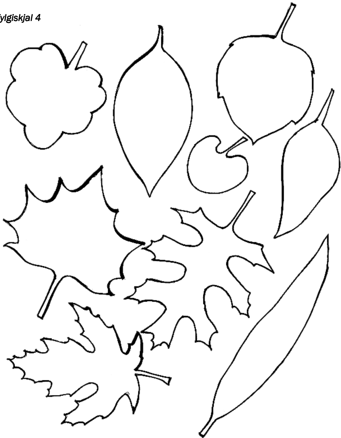
Mynd 3: (Danielle's place of Crafts and Activities)