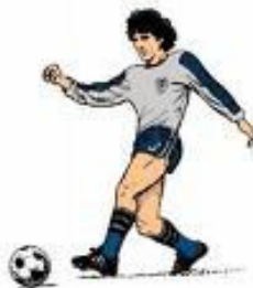
Bolti eða maður?