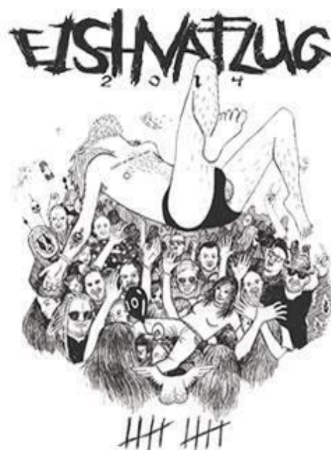
Mynd 4. Þessi mynd lýsir ýmsu sem á sér stað á hátíðinni, meðal annars múgflot.

Annað dæmi sem mætti nefna í þessu samhengi er múgflotið. Í þessum athöfnum eru líkamlegar snertingar mjög áberandi en á sama tíma viðurkenndar. Þá sækir fólk í athafnirnar af því það veitir þeim útrás og vellíðan. Einkenni þessara athafna eru dæmigerð einkenni leiks; afmarkað svæði en algjört frelsi eins og tími og rúm leyfir (Huizinga, 1970: 41).