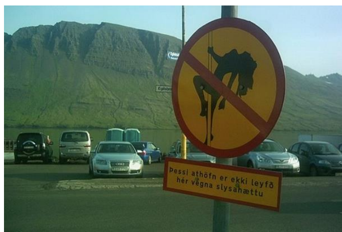
Mynd 3. Fengin af vefritinu Pressunni (2013): Þessi athöfn er ekki leyfð hér vegna slyshættu.

Óhætt er að segja að umrætt skilti hafi vakið mikla athygli, bæði meðal bæjarbúa og gesta hátíðarinnar. Fimmtudaginn 11. júlí 2013, daginn eftir að vinkonur Fjólu settu skiltið upp, birtist frétt á vefritinu Pressunni undir heitinu „Mynd dagsins: Súludans bannaður á Neskaupstað“ (2013).