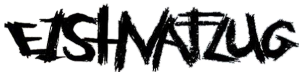
Mynd 2. Fengin af heimasíðu Eistnaflugs (e.d.). Einkennismerki hátíðarinnar.