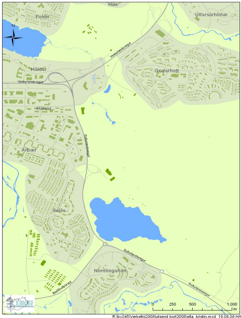
Mynd 6.2: Árbær og Grafarholt.

þjónustumiðstöðvarinnar. Starfsfólk þjónustumiðstöðvarinnar kom með ábendingu þess efnis til borgaryfirvalda og var nafni þjónustumiðstöðvarinnar þá breytt í Þjónustumiðstöð Árbæjar og Grafarholts. Þegar hverfisráðin voru stofnuð átti hverfisráð Árbæjar að sinna Grafarholtinu, síðar var því skipt upp í tvö hverfisráð, hverfisráð Árbæjar og hverfisráðs Grafarholts og Úlfarsárdals. Úlfarsárdalur er yngsta hverfi borgarinnar það er austur af Grafarholtinu og er stutt síðan að það hverfi fór að byggjast. Sjá mynd 6. 2: