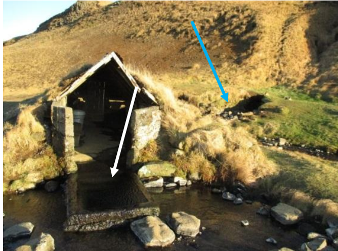
Mynd 3. Bláa örin bendir á eldri, hlöðnu laugina. Hvíta örin bendir á steypa fjárbaðið

Í nóvember fór ég í vettvangsferð að Hrunalaug í þeirri von að svæðið væri ekki búið að breytast um of til verri vegar. Til að komast að Hrunalaug er beygt útaf veginum við Hruna, við veginn framhjá Hrunalaug er búið að leggja lítið bílaplan en það var gert til þess að gestir lokuðu ekki umferð að sveitabænum Sólheimum og til þess að minnka bílaumferð að sjálfri lauginni.