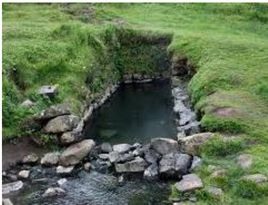
Mynd 7. Laugin eins og hún var í minningunni

fyrir skemmdum og gróður er orðinn niðurtroðinn. Náttúran okkar er stórfengleg en aftur á móti er ákaflega mikilvægt að við gerum okkur grein fyrir takmörkum landsins svo að við völdum ekki óafturkræfum skemmdum með óvarkárni eða spillingu. Þarna kemur fram gott dæmi um að staldra við og búa okkur undir að hægt væri að huga að viðhaldi á svæðinu svo