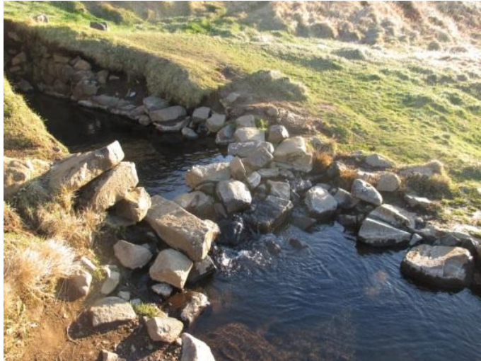
Mynd 1. Búið er að hlaða stíflu úr gömlum hleðslum, einhverjum til skemmtunar

Heit uppspretta hefur verið til staðar við kirkjustaðinn Hruna í aldaradír. Fyrstu þvottalaugarnar sem nýttar voru fyrir á öldum eru nú sokknar í dý, einungis sést til lágrar hleðslu núorðið. Uppsprettuvatn sem rennur eftir heitri klöpp á þessum stað var mjög dýrmætt til að nýta við þvotta. Eiríkur Jónsson, langalangafi minn (f. 8. júlí 1836 – d. 23. maí 1898) bóndi frá Sólheimum í