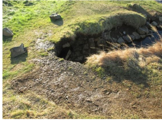
Mynd 5. Miklar skemmdir hafa verið unnar á bakka laugarinnar

Á mynd 5 sést bakkinn á gömlu lauginni, þar hafa verði unnar skemmdir af yfirlögðu ráði. Þremur steinum úr hleðslunni hefur verið kastað upp á bakkann. Einnig má nefna að bakkinn var ferhyrndari og hlaðinn, en nú hefur brotnað úr honum sökum ágangs og skemmdarverka. Á mynd nr. 6 má sjá gömlu lagina eins og hún var fyrir nokkrum árum, en á mynd nr. 7 sem tekin var í nóvember má sjá að endi laugarinnar hefur orðið