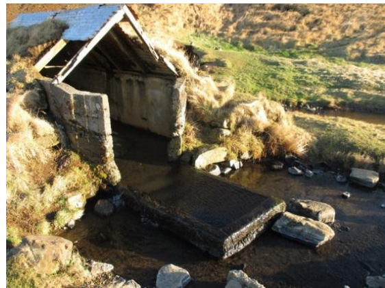
Mynd 4. Þörf fyrir viðhald er aðkallandi.

Á mynd 3. má sjá gömlu þvottalaugina í baksýn og yngri steypa laugin er frammar á myndinni. Sú laug var notuð til að baða sauðféð en í dag er hún eingöngu notuð af fólki til að baða sig. Þó staðurinn liggi nálægt vegi er hann samt sem áður nægilega afvikinn svo þar má slaka á og ná hugarró með sjálfum sér. Á mynd 4 má sjá að kofinn sem byggður var sem skjól er illa farinn og bárujárnið er farið að losna af samhliða því að spýturnar sem halda þakinu eru að fúna. Hér sést að viðhald er orðið mjög nauðsynlegt og tímabært ef staðurinn á að halda aðdráttarafli sínu, það getur skapast hætta af ef fólk dytti í hug að klifra upp þakið sem auðvitað á ekki að gera.