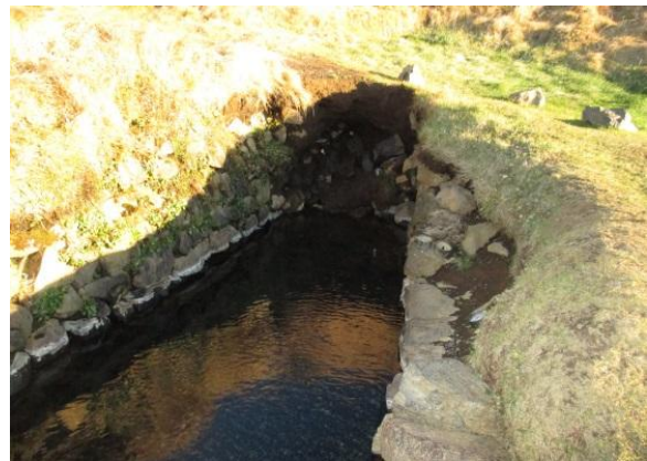
Mynd 6. Ástand laugarinnar í nóvember 2014

ekki þurfi að takmarka ferðamannafjöldann um landsvæðin. Laugin hefur aðdráttarafl sem leiðir til þess að menn vilja koma aftur, en þessu aðdráttarafli er auðvelt að glata, sem og umburðarlyndi landeigenda, ef gestir ganga um af tillitsleysi. Þarna gegna samskipti mikilvægu hlutverki.