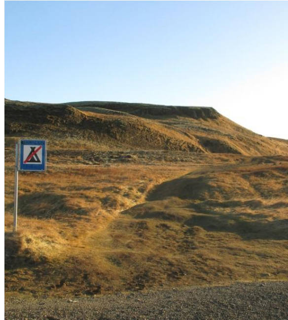
Mynd 2. Svona lítur slóðinn upp að lauginni út í dag.

og kalda jökla. Um leið og erlendir ferðamenn koma til Íslands eru landakortin opnuð og sumir jafnvel staðráðnir í að heimsækja fyrirfram ákveðna áfangastaði. Draumur sem verður að veruleika eða áskorun við sjálfan sig. Við Íslendingar erum mjög stolt af náttúrunni okkar en við gerum okkur alltaf betur og betur grein fyrir því að um leið og ferðamannastraumurinn eykst hefur það í för með sér aukinn ágang á ákveðnum stöðum með ófyrirsjáanlegum afleiðingum. Ásókn að stærstu ferðamannastöðunum, Þingvöllum, Gullfoss og Geysi er í núverandi ástandi að ná