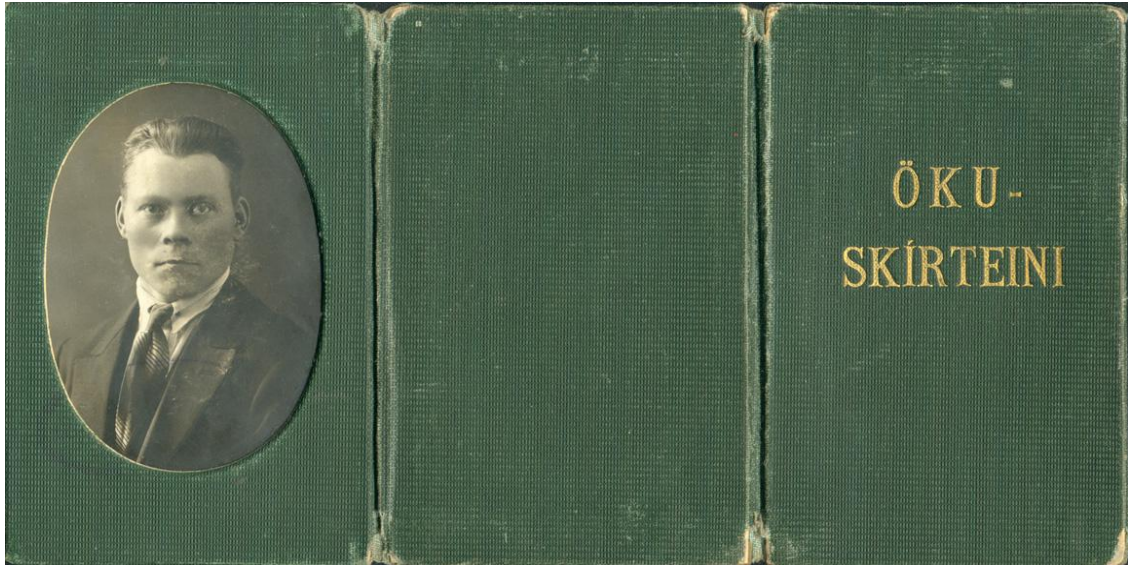
Mynd 1. Kápa ökuskírteinis Ólafs Ketilssonar.