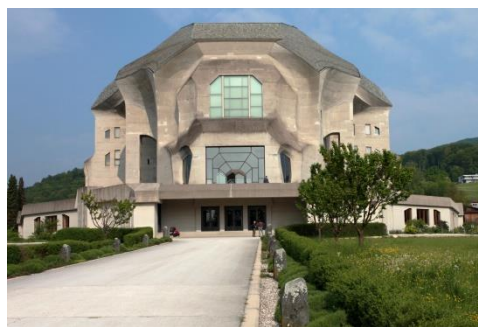
Mynd 2. Goetheanum