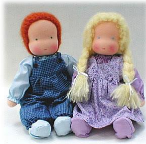
Mynd 4. Waldorfdúkka

heima eða í litlu magni af dúkkugerðarfólki. Notuð er lamsull til þess að fylla dúkkuna að innan til þess að hún verði hlý viðkomu þegar verið er að handleika hana og þá lifnar hún við í augum barnsins. Hún drekkur í sig lykt heimilisins og verður eins og einn af heimilisfólkinu (Paine, 2011-2015).