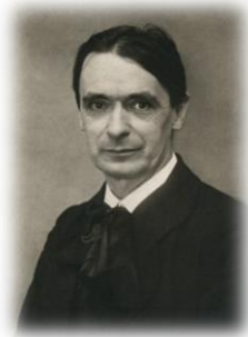
Mynd 1. Rudolf Steiner