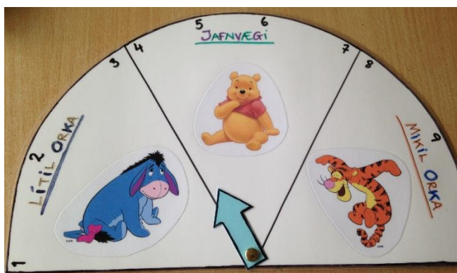
Mynd 3 Orkuskífa Bangsímmons.

lýst vel, hvað þarf að tala um, hvernig hægt er að tala um þá hluti og bent á hugmyndir að hjálpargögnum. Með þessum hætti er auðvelt fyrir starfsfólk skólans að vera með uppbyggingastundir á sinni deild þó það hafi litla þekkingu á Uppeldi til ábyrgðar (eins og til dæmis nýjir starfsmenn) eða er óöruggt á einhvern hátt.