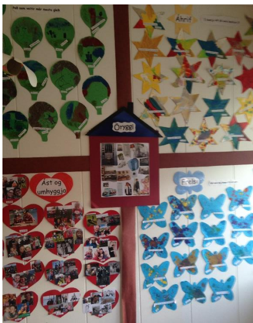
Mynd 4 Þarfakross á vegg.

Hver þörf fær sér stund þar sem notast er við efnivið sem starfsfólk skólans hefur sankað að sér til að útskýra hverja þörf fyrir sig. Börnin fá góðan tíma til að meðtaka hverja þörf.