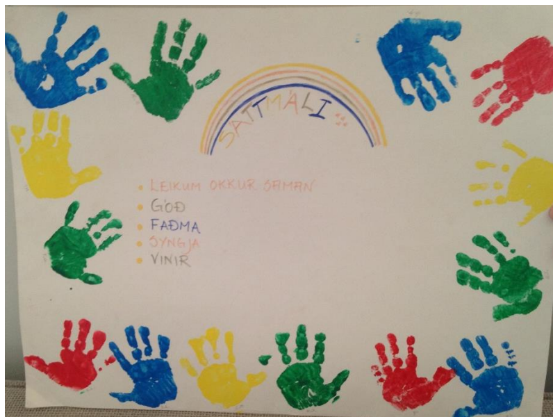
Mynd 2. Sáttmáli

Sáttmáli er samningur sem hver bekkur, deild og skóli gera í sameiningu þar sem ákveðin lífsgildi eru skráð á veggspjald. Þessi lífsgildi eru eitthvað sem allir í hópnum geta verið sammála um að nauðsynlegt sé að fylgja, eitthvað sem allir vilja fara eftir og virða til að stuðla að góðu samstarfi og vellíðan allra innan hópsins. Allir í hópnum skrifa undir þennan sáttmála og hafa trú á þessum lífsgildum og er það þannig vilji allra í hópnum að þessi lífsgildi séu virt. Á þennan hátt koma lífsgildin frá hópnum í sameiningu en ekki frá yfirvaldi með hótanir um refsingu. Þannig kemur viljinn til að viðhalda lífsgildunum innan frá hverjum og einum þar sem þetta eru þeirra eigin lífsgildi til að standa við (Gossen, 2002b).