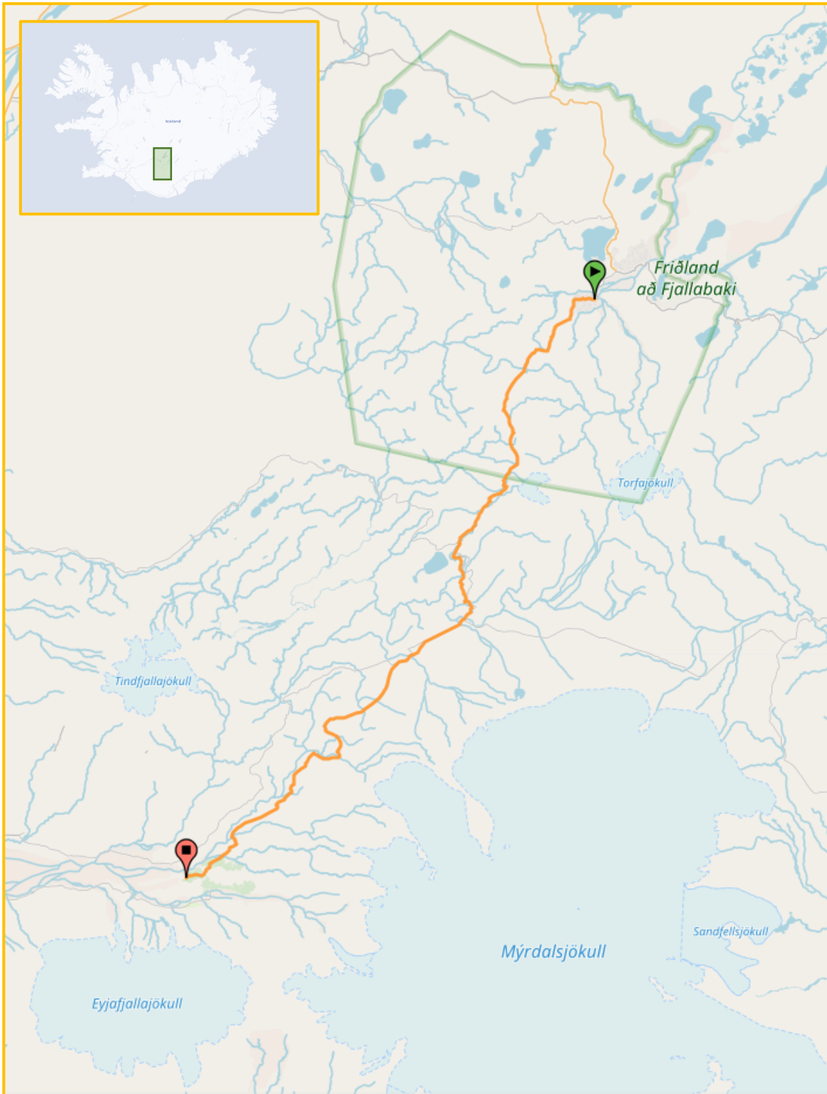
Mynd 1 : Kort af svæðinu umhverfis Laugaveginn (Kort eftir höfunda)