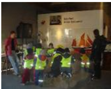
Mynd 5 Börn í sögustund í bátasafninu