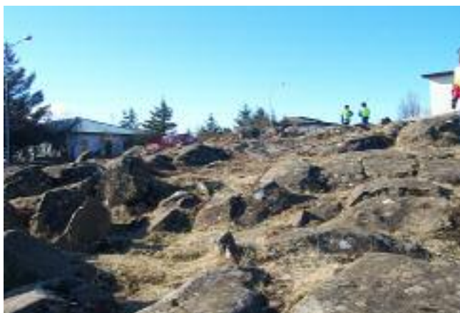
Mynd 3 Hrauntúnsholtið

Hrauntúnsholtið er kallað því nafni vegna legu þess á milli tveggja gatna, Hrauntúns og Tjarnargötu. Holtið er lítið með lágum klöppum, litlum grasböllum og íslenskum lággróðri, mikið er af lúpínu þar á sumrin, einnig er svolítið berjalýng í holtinu. 55