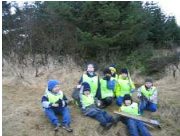
Mynd 1 Börn að leik í Vatnsholtinu

Vatnsholtið stendur við endann á Tjarnargötu, það tekur um það bil tíu mínútur að ganga á staðinn. Vatnsholtið er víðfemt grjótholt með skógarlundi, villtum lággróðri, lyngi, mosa, plöntum og trjám. Holtið dregur nafn sitt af vatnstanki sem þar er. Skógræktarfélag Suðurnesja hefur umsjón með skógarlundinum. Svæðið er afar vinsælt til vettvangsferða á öllum árstímum. 52