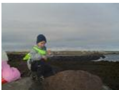
Mynd 7 Fjaran í Innri-Njarðvík