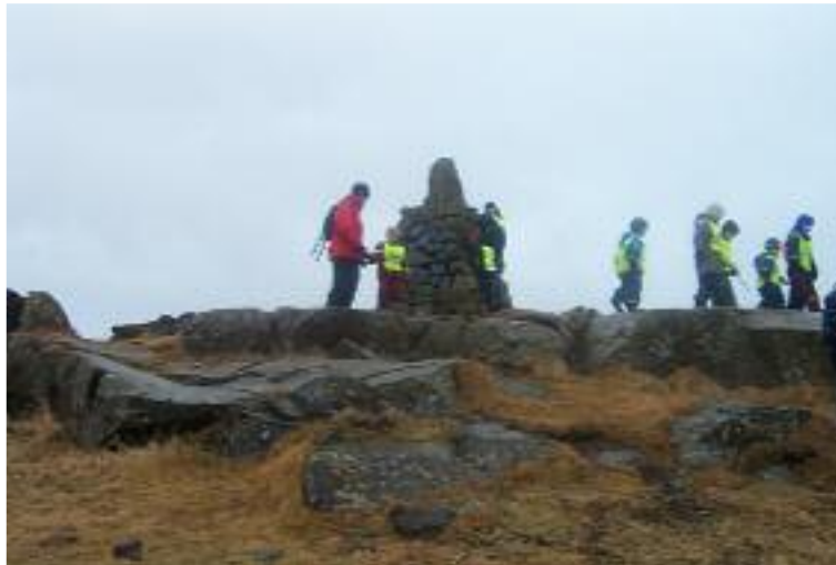
Mynd 2 Börn að leik í Nónvörðunni

Nónvarðan stendur á milli tveggja gatna sem heita Smáratún og Hátún. Það tekur okkur um það bil fimmtán mínútur að ganga á staðinn. Nónvarðan er holt með nokkuð háum klöppum, nafnið er dregið af stórri og mikilli vörðu sem stendur efst uppi í holtinu. Inn á milli klettanna vex gras og villtur lággróður.