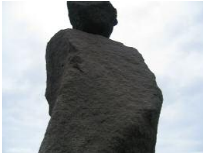
Mynd 9 Tröll í návígi.

Tröllin hafa verið sett niður á nokkrum áhugaverðum stöðum í bæjarfélaginu, börnum til mikillar ánægju. Tröllin ýmist standa og horfa hvort á annað, eða þau standa og horfa yfir sjóinn. Sums staðar eru þau sem fjölskylda uppi á hæð eða niður við sjó.