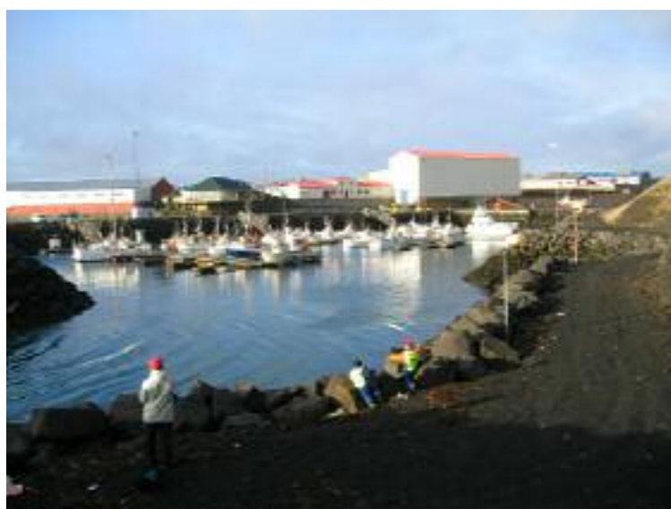
Mynd 4 Smábátahöfnin í góðu veðri.

Það er margt merkilegt sem fyrir augu ber á leiðinni niður í Gróf sem er það svæði sem liggur við sjóinn vestast í bænum og þar er að finna meðal annars smábátahöfnina, Svarta skúta sem er lítill hellisskúti og hlaðinn grjótgarð. Leiðin þangað er í gegnum gamla bæinn í Keflavík þar sem eru hlaðnar götur og gömul uppgerð hús og gefa oft tilefni til spurninga á leiðinni.