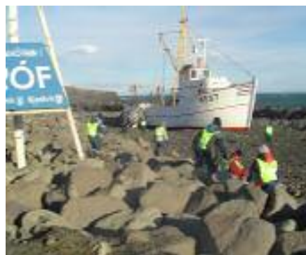
Mynd 6 Börn að leik við Baldur

Þekking á því liðna er einn þáttur umhverfisvitundar. Því er nauðsynlegt að kynna fyrir börnum sögu hvers bæjarfélags fyrir sig og umhverfið gefur tilefni til að ræða við og segja börnunum frá því hvernig hlutirnir voru um aldamótin 1900. Til dæmis voru börnin í Keflavík um aldamótin 1900 að leika sér í Kýlubolta og Yfir, París, Gluggapara og Sto eins og önnur börn. Leiksvæðin voru allt um kring, engir rólúvellir, heldur óspillt náttúran sem var trúlega sú hollasta félagsmiðstöð sem hugsast getur. 56