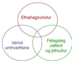
Mynd 1 Stoðir sjálfbærrar þróunar sem aðskildir þættir