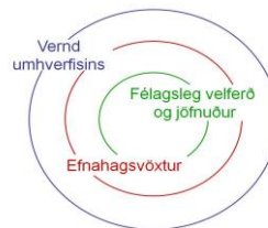
Mynd 2 Stoðir sjálfbærrar þróunar sem samofin heild.