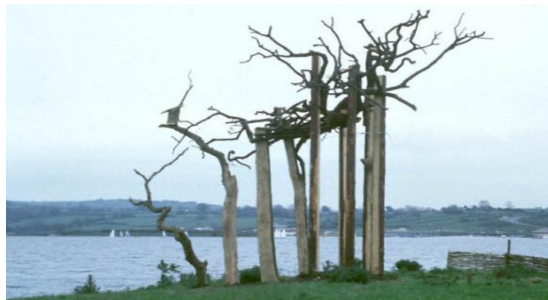
Mynd 5 Skúlptúr, sambýli fyrir vatnafugla