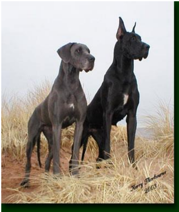
Mynd 2 - Hér eru tveir hundar af tegundinni Stóri Dan. Vinstri hundurinn er með náttúruleg eyru en eyru hundsins til hægri hafa verið klippt og stífð til að fá þau upprétt

tegund sem þessari, eða að minnsta kosti forverar þeirra, hafa verið fjarlægðir frá sínu náttúrulega umhverfi og fengu engu um það ráðið.