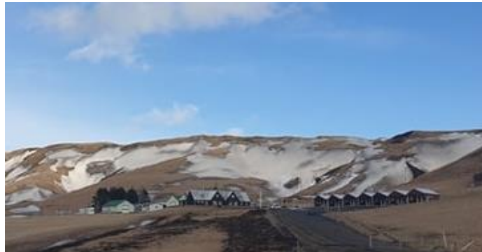
Mynd 4: Bærinn Götur (t.v.) og hús til útleigu fyrir ferðamenn (t.h.).

Ferðamennskan hefur ekki aðeins haft áhrif á Vík en bændur í sveitunum í kring hafa ekki farið varhluta af þróuninni. Mörg dæmi eru um að bændur sem ekki sáu fyrir að geta haldið úti búskap mikið lengur hafi breytt húsum og hlöðum sínum í gistiheimili fyrir ferðamenn og þannig hafið ferðaþjónustubúskap í takt við breytta tíma.