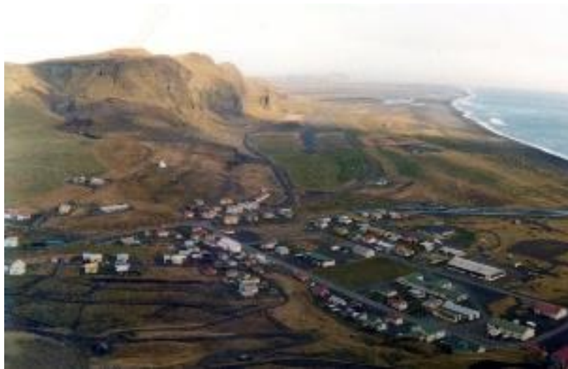
Mynd 1: Vík um það bil árið 1977