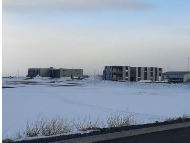
Mynd 5: Hótel Kría (t.v.) og íbúðarhúsnæði sem var byggt undir starfsfólk hótelsins (t.h.).