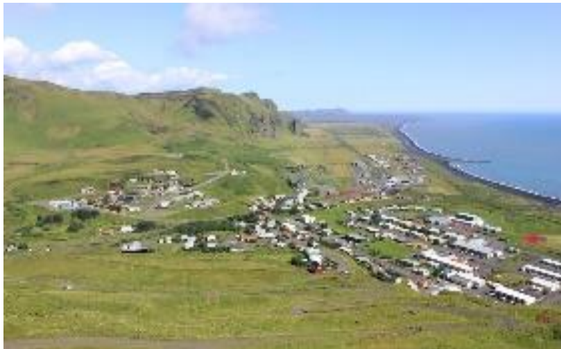
Mynd 2: Vík árið 2019

Miklar breytingar hafa orðið á íbúafjölda í Mýrdalshreppi á síðustu áratugum. Sveitarfélagið fór úr því að vera næstum eingöngu íslenskir ríkisborgarar yfir í að vera alþjóðlegasta þorp landsins þar sem um 40% íbúa eru erlendir ríkisborgarar (Kristján Már Unnarsson, 2019). Samkvæmt tölum Hagstofu Íslands (2020a) voru í byrjun árs 2020 719 manns með skráða búsetu í Mýrdalshreppi og er það aukning úr 526 árið 1998. Fólki á svæðinu hefur fjölgað jafnt og þétt síðustu ár og þá mest erlendum ríkisborgurum eins og sést á mynd 3 hér að neðan. Árið 2010 höfðu aðeins 30 erlendir ríkisborgarar búsetu í Mýrdalshreppi en þeir voru orðnir 390 í byrjun árs 2020 (Hagstofa Íslands, 2020b). Erfitt er að finna upplýsingar um hvernig atvinnuskipting í Mýrdalshreppi er í dag en líklegt er að stór hluti þeirra sem hafi þar atvinnu vinni við ferðaþjónustu nú til dags.