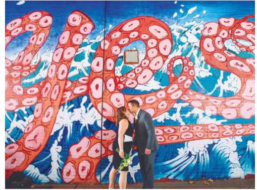
Mynd 14: Brúðkaupsmyndataka fyrir framan litríku veggmyndina

Hér er sýnt fram á hvernig fegurð getur breytt hegðun okkar allt frá hvernig okkur líður og til þess í hverju við fjárfestum. Nokkur dæmi eru tekin þar sem sýndar eru jákvæðar afleiðingar þess að umbreyta vanræktu svæði með fallegum hætti. Sagt er frá hvernig Sagmeister & Walsh vinnustofan breytti undirgöngum í Brooklyn til hins betra en áður fyrir átti drukkið fólk það til að míga í undirgöngin á leið heim frá bar í nágrenninu. Málað var afar litríkt yes á annan vegginn í undirgöngunum og svo annað grafískt, svart og hvítt yes á hinn. Eftir þetta vildi svo skemmtilega til að nýgift pör byrjuðu að nota veggina sem bakgrunn fyrir brúðkaups-myndatökurnar sínar. Sagmeister & Walsh vilja meina að þau hafi breytt undirgöngunum úr klósetti yfir í kapellu. 28