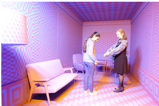
Mynd 6: Litaherbergið þakið köflóttu munstri

litbrigði virtust grá og við það gjörbreyttist herbergið. Hér er reynt að sýna fram á að litadýrð sé almennt talin fallegri en einsleitni. 18