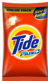
Mynd 7: Tide Plus fékk 2,716 atkvæði af 6,321 atkvæðum

Þegar talað er um fallegar pakkningar í bókinni, vísa þau aftur í þýska sálfræðinginn Helmut Leder. Hann grunar að til þess að varðveita þá miklu orku sem heilinn þarfnast á meðan á ákvarðanatökum stendur, noti hann fegurð sem flýtleið til þess að taka ákvarðanir hraðar. Það myndi því hver sem er búast við því að hönnuðir settu fegurð í forgangi þegar kæmi að hönnun matvöruumbúða en Stefan finnst bandarískar matvöropakkningar ekkert sérstakar. Hann segir að þær gefi oft til kynna ferskleika en ekki endilega á fallegan hátt. Í framhaldi af þessu er sýnd könnun sem fór fram á Instagram síðu Sagmeister og Walsh vinnustofunnar. Þar er valið á milli sex mismunandi þvottaefnispakkninga og þau sem fengu flest atkvæði voru Ariel Auto og Tide Plus. Vert er að benda á að þessar tvær pakkningar birtu fæstu litina af öllum sex pakkningum sem kann að fara gegn því að litadýrð hafi oftast vinninginn í fegurð. 21