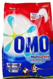
Mynd 8: OMO Multi active fékk 81 atkvæði af 6,321 atkvæðum