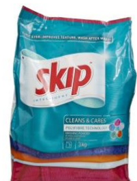
Mynd 10: Skip fékk 698 atkvæði af 6,321 atkvæðum