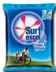
Mynd 11: Surf excel fékk 71 atkvæði af 6,321 atkvæðum