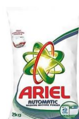
Mynd 12: Ariel auto fékk 2,636 atkvæði af 6,321 atkvæðum