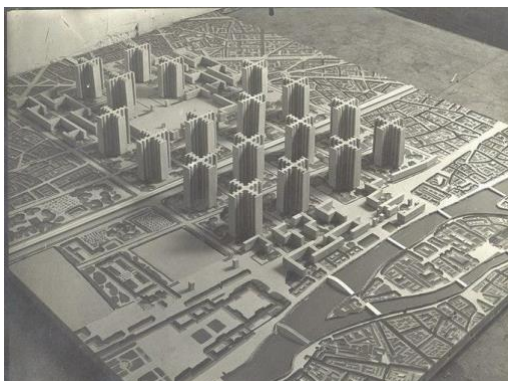
Mynd 15: Líkan af breytingu borgarstrúktúr Parísar sem Le Corbusier lagði til

Sagmeister talar um hvernig hugmyndir Loos teygðu sig um allan heim og brátt mátti sjá