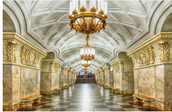
Mynd 17: Núverandi neðanjarðarlestarstöð í Moskvu