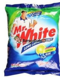
Mynd 9: Mr. White fékk 119 atkvæði af 6,321 atkvæðum