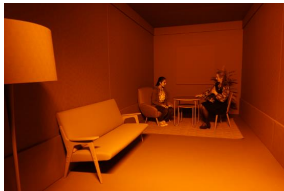
Mynd 5: Litaherbergið einlitt