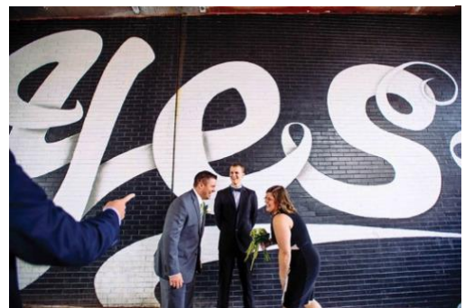
Mynd 13: Sama myndataka með svarthvítu veggmyndina í bakgrunni