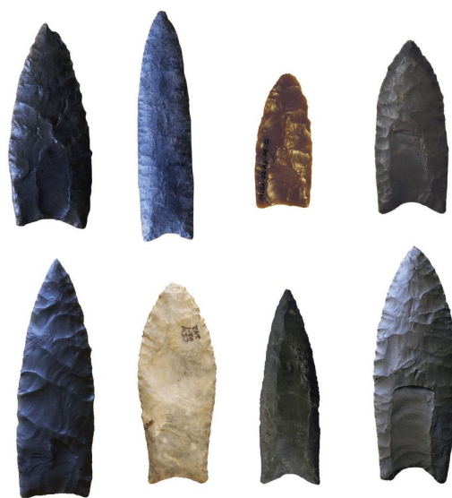
Mynd 2: Clovis oddar frá norður-Ameríku