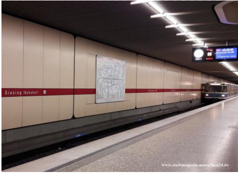
Mynd 16: Núverandi neðanjarðarlestarstöð í München

Þýskalandi. Allar líta þær eins út og eina leiðin fyrir utanaðkomandi aðila til að vita hvar hann er niðurkominn, er að leita að litlu skilti sem segir til um það. Í Moskvu, Rússlandi, er hins vegar hver stöð frábrugðin annarri og ferðamenn gera sér það að dagsferð, að stoppa á hverri einustu stöð til þess að taka myndir af stórbrotinni byggingarlistinni sem blasir við þeim. 43