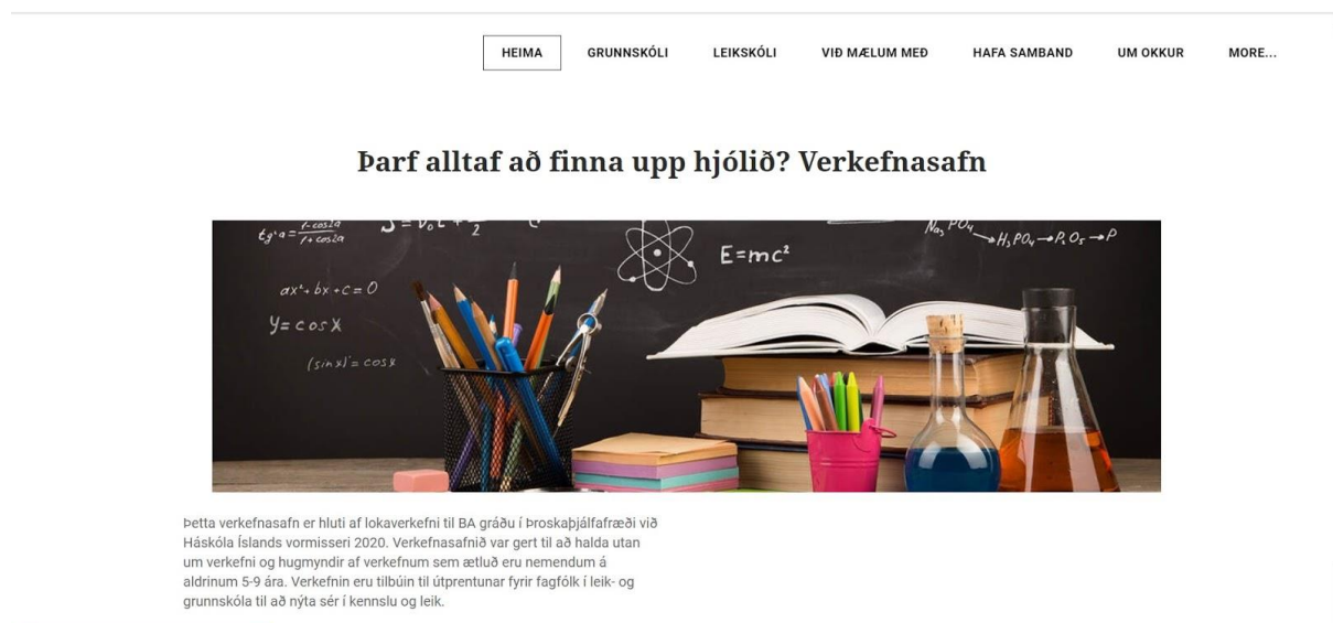
Mynd 1 Hér sést mynd af forsiðu verkefnasafns

og fleira. Mikill kostur er einnig að margir geta unnið að síðunni í einu. Okkar markmið er að hafa síðuna einfalda og aðgengilega. Vinnan við vefsíðuna gekk vel framan af. Hindranir komu fram í vefsíðugerðinni sem verður ekki farið nánar út í en varð til þess að ákveðið var að breyta um vefsvæði. Var það vissulega okkar upplifun að google sites væri mjög einfalt og þægilegt í notkun en því virtist fylgja mjög takmarkað viðmót á aðgerðum og skipunum sem hægt var að gera í uppbyggingu vefsíðu. Önnur vefsvæði sem Jón hafði mælt með voru skoðuð og ákveðið var að breyta í vefsvæði sem heitir Weebly. Það vefsvæði er flóknara en býður að sama skapi upp á fleiri möguleika. Weebly er gjaldfrjálst vefsvæði í grunninn en hægt er að greiða árgjald til að fá aukið aðgengi að meiri möguleikum vefskipanna, útlits og gagnamagns. Þess þurfti ekki í okkar tilfelli þar sem einfalt vefsíðuútlit varð fyrir valinu til að draga ekki athyglina frá innihaldi síðunnar.