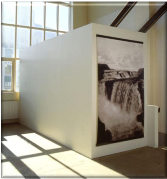
Mynd 5. Tímans rás (Rúri-Gallerí [2009]).

Listaverkið Tímans rás byggir á gömlum ljósmyndum af fossum á Íslandi en elstu ljósmyndirnar eru meira en aldar gamlar. Hver ljósmyndari sér landið sínum augum og ljósmyndirnar eru því persónuleg túlkun þeirra á þeim áhrifum sem viðfangsefnið veitir þeim. Í framsetningu listaverksins virðir Rúri fullkomlega túlkun upprunalegu ljósmyndaranna. Verkið er minnisvarði um hvaða áhrif fossarnir höfðu á þá hvern og einn, á hverjum tíma. Sumir fossanna í verkunum hafa breyst eða