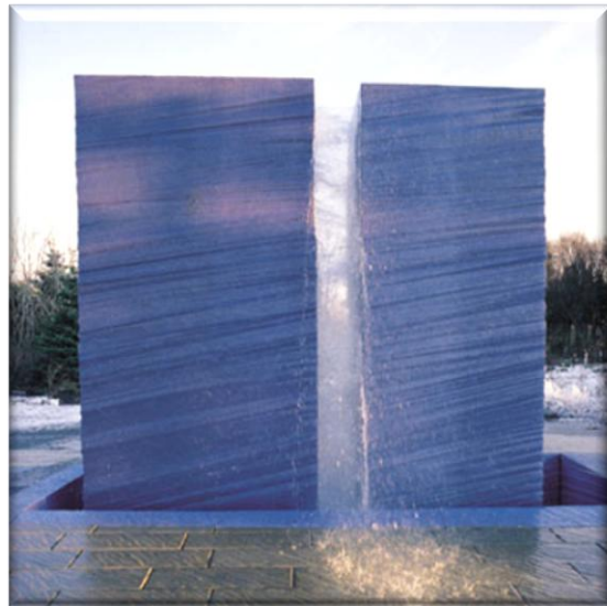
Mynd 4. Fyssa (Rúri-Gallerí [2009]).

Nafn listaverksins, Fyssa , er samstofna orðinu foss. Hugmyndin að baki verksins eru náttúruöfl Íslands. Sprungur og gjár myndast í jarðskjálftum og berggangar verða til í gosum. Vatn safnast í gjárnar það frýs og klýfur bjargir. Listaverkið stendur að hluta til upp úr yfirborði jarðar og að hluta til gengur það niður í jörðina og myndar gjá. Það myndar línu í gegnum steinlögnina í garðinum sem