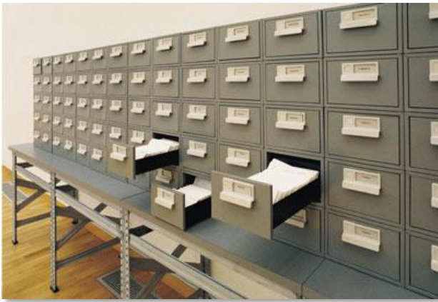
Mynd 3. PARADÍS?-Hvenær? (Rúrí-Galleri [2009]).