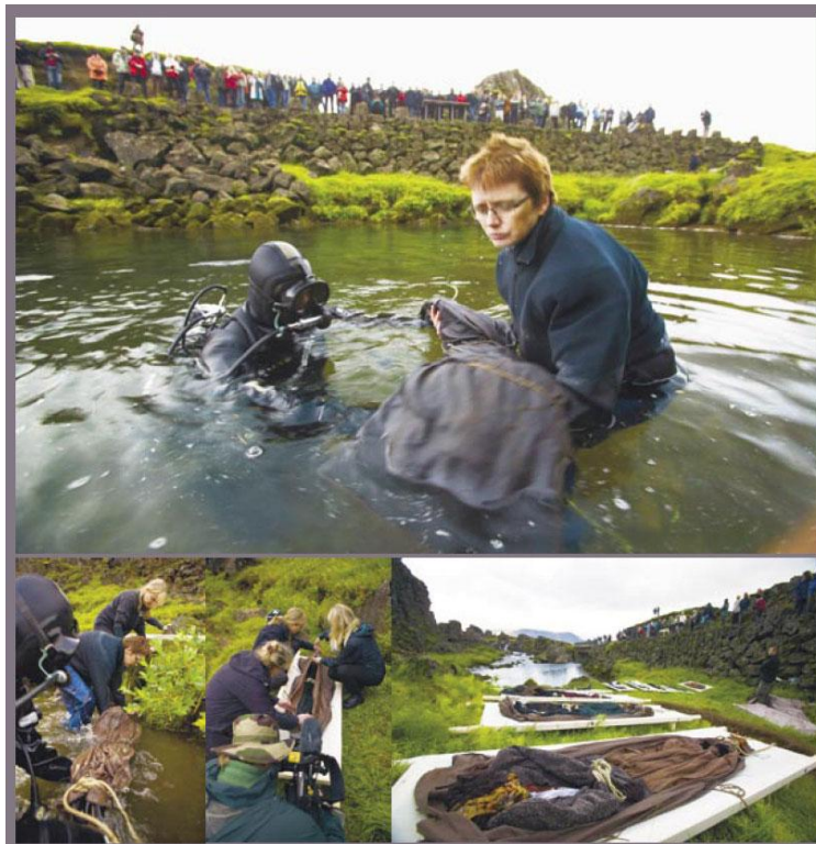
Mynd 2. Tileinkun (Rúrí-Gallerí [2009]).

Dæmi um innsetningar sem Rúrí hefur framkvæmt er m.a. verkið Tileinkun . Tileinkun er gjörningur og innsetning sem fluttur var í og við Drekkingsrhyll á Þingvöllum 5. september árið 2006. Gjörningurinn, er tók um 90 mínútur, var framdur í tengslum við sýninguna Mega Vott og er tileinkaður minningu þeirra stúlkna og kvenna sem þar voru teknar af lífi á 17. og 18. öld fyrir þær sakir einar að verða þungaðar og ala börn utan hjónabands (Rúrí-Gallerí [2009]). Hugmyndin sem liggur að baki þessum gjörningi hefur mjög sterka samfélagslega tilvísun. Þó svo að við höfum öll heyrt um Drekkingsrhyll og örlög þeirra kvenna sem þangað voru dregnar þá færir Rúrí okkur nær þeim atburði. Með verkinu lætur hún okkur huga að því að slíkt óréttlæti og átti sér stað á Þingvöllum fyrir mörgum öldum síðan á sér enn stað í dag en oft í annarri mynd. Konur, menn og börn eru enn í dag beitt ranglæti víðs vegar um heiminn og við höfum ekki rétt á að hunsa það aðeins vegna þess að það er okkur ekki alltaf sýnilegt.