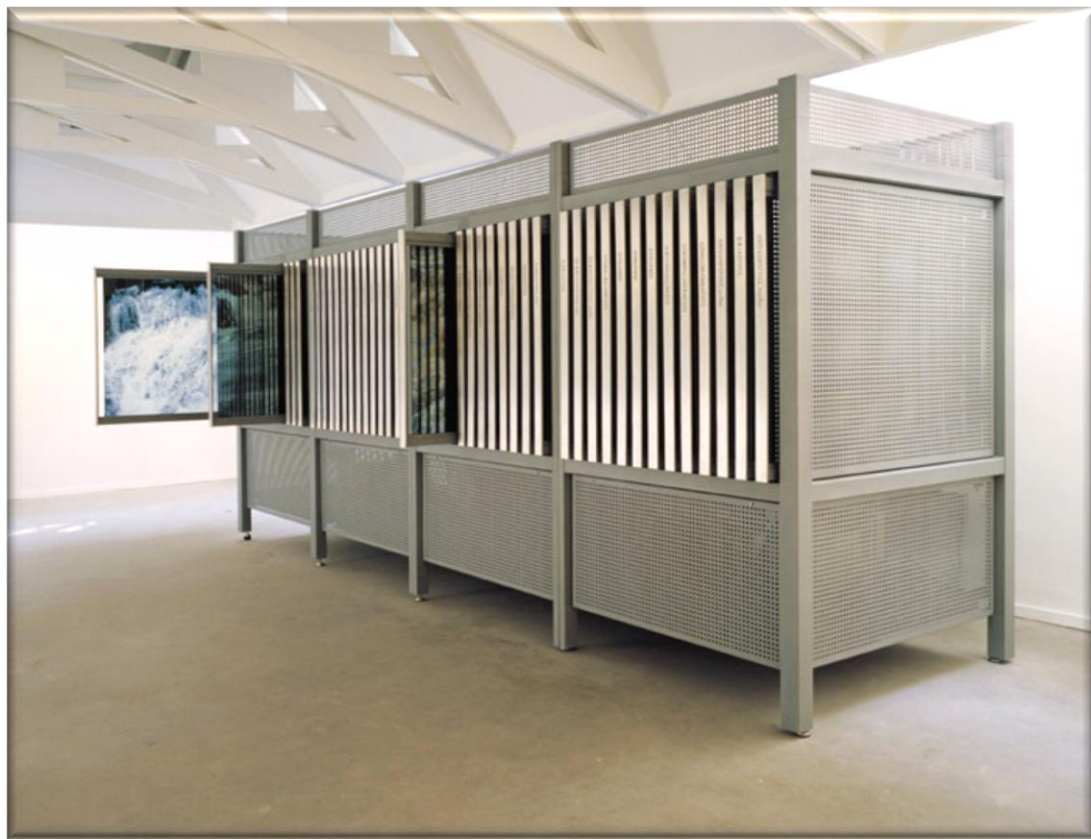
Mynd 7. Archive-endangered waters (Rúri-Gallerí [2009]).

Archive-endangered waters líkt og hún hefur gert oft áður og glerið tengist hugmyndalegu inntaki þess. Það er lifandi, getur runnið eins og vatn, verið traust og sterkt en það getur líka molnað niður í smáparta við minnsta álag. Glerið undirstrikar því hina brothættu og varhugaverðu framtíð fossanna. Ljósmyndin tengist líka tímanum því hún er frosið augnablik og vottar um það sem hefur gerst í liðinni tíð(Laufey Helgadóttir 2003).