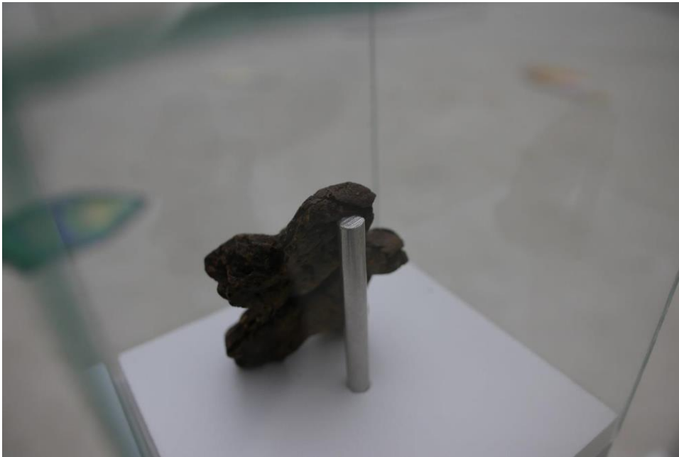
Róbert Risto Hlynsson Cedergren, Sjálfmynd úr sjálfum mér , 2021, kúkur, stöplar og gler.