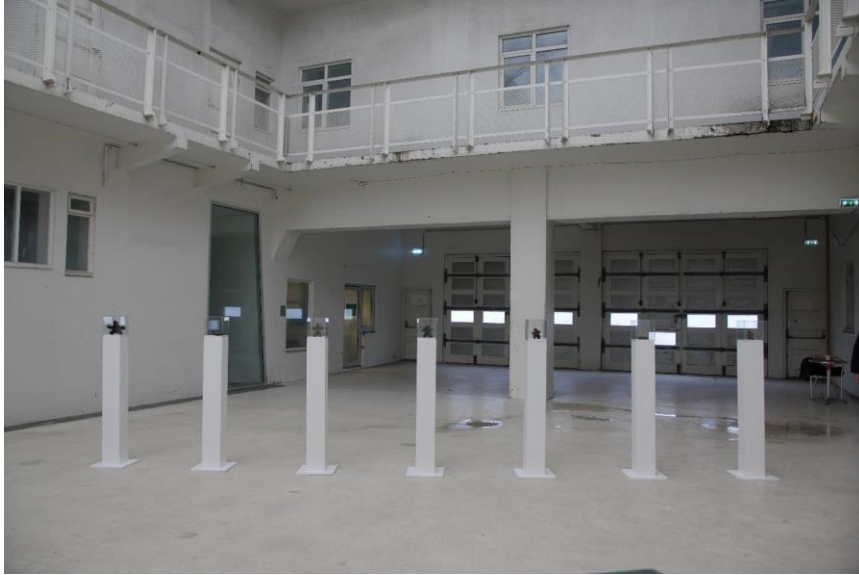
Róbert Risto Hlynsson Cedergren, Sjálfsmynd úr sjálfum mér , 2021, kúkur, stöplar og gler.