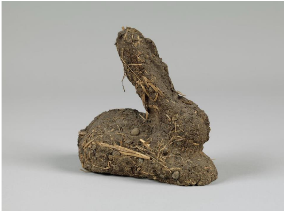
Dieter Roth, Bunny-dropping-bunny ( Karnickelköttelkarnickel ), 1968, skúlpúr úr kanínukúk.