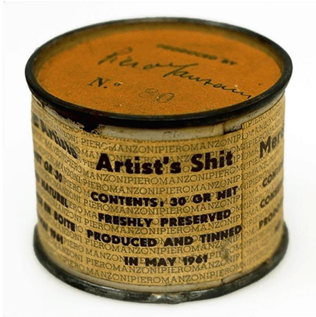
Piero Manzoni, Artist shit, 1961, kúkur í niðursöðudós.