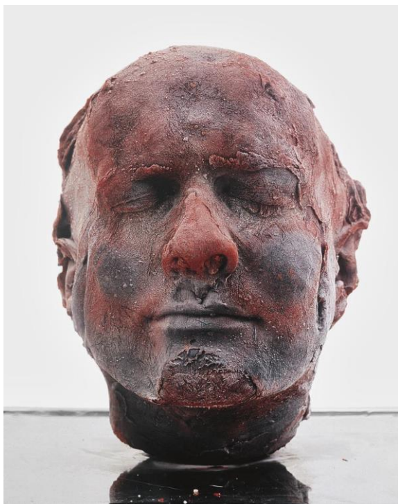
Marc Quinn, Self , 1991, skúlpúr úr blóði.