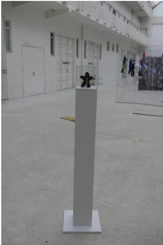
Róbert Risto Hlynsson Cedergren, Sjálfsmynd úr sjálfum mér , 2021, kúkur, stöplar og gler.