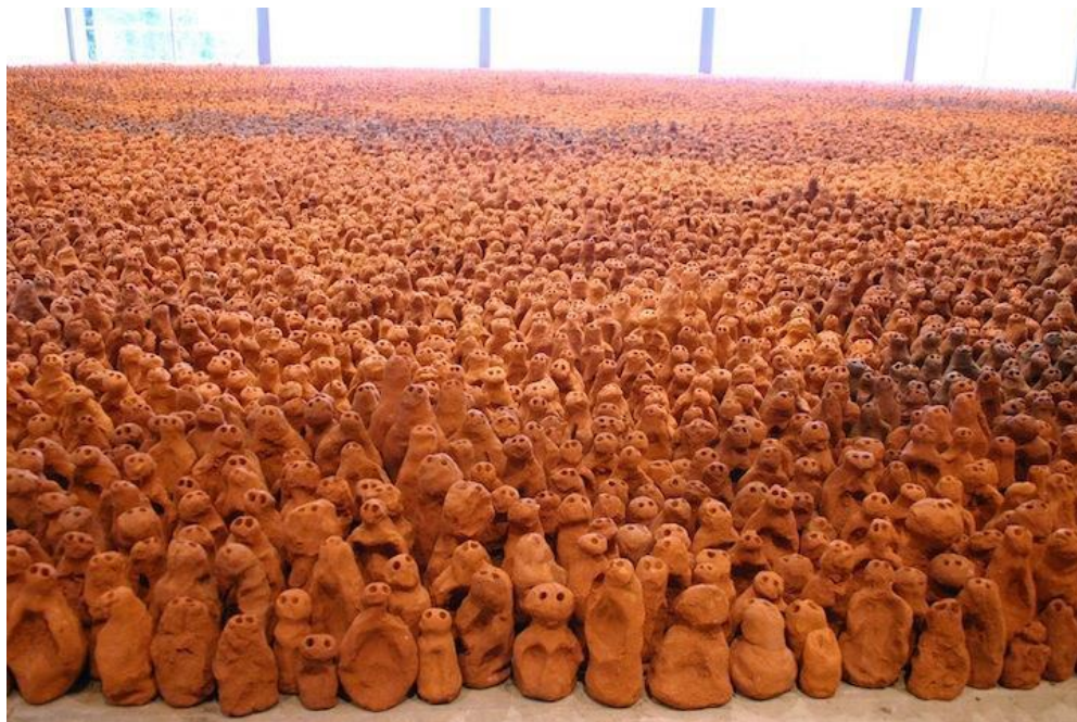
Antony Gormley, Fields , 2012, 200,000 leir skúlptúrar.