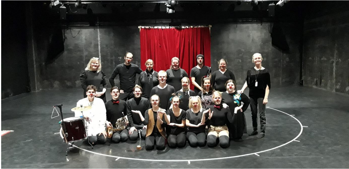
Mynd 2 – Þátttakendur á trúðanámskeiðinu ásamt kennurum 2019.

Við vissum báðar frá byrjun að við vildum vera flytjendur í verkinu og að við vildum skapa söguna frá grunni. Í byrjun var markmiðið okkar að hafa hljómsveit skipaða allskonar hljóðfærum. Einnig ætluðum við að fá fleiri leikara með okkur á sviðið. Markmiðið var að við myndum skrifa handrit og semja síðan löggin og fá svo einhvern til að útsetja löggin fyrir hljómsveit. Þau plön breyttust þó þegar Covid-19 skall á, þá þurftum við alvarlega að íhuga hvað við vildum hafa mikið af fólki með okkur í þessu verki. Að lokum ákváðum við að flytjendur og handritshöfundar verksins værum við tvær ásamt skipuðum leikstjóra og tónsmið sem myndi hjálpa okkur við að semja tónlist.