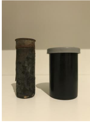
Mynd 8: Til vinstri: Haglaskot, til hægri hólkur utan um filmur

Þar sem að pabbi minn er „byssukall“ á hann sitt safn af bæði skotvopnum og öðrum aukahlutum tengdum þeim. Í rannsóknarvinnunni gerði ég mér ferð inn í geymslu heima hjá honum þar sem við tókum meðal annars í sundur nokkur mismunandi skotvopn. Í þessum rannsóknarleiðangri skoðaði ég einnig mismunandi tegundir af sjónaukum og skotum. Það sem mér fannst áhugaverðast við þessa rannsókn var að þegar ég tók upp byssuna hans þurfti ég að leggja kinn mína upp að skafti byssunnar til þess að sjá í gegnum sjónaukan og loka vinstra auganu. Tilfinningin sem ég upplifði var ansi lík þeirri sem ég fæ þegar ég horfi í gegnum sjáaldur á myndavél. Andlit mitt er klesst upp við myndavélina og ég þarf að loka öðru auganu til þess að sjá út. Helsti munurinn var að skotvopn eru talsvert þyngri en hefðbundnar myndavélar, en þessi ritúali (e. ritual) sem að á sér stað var á einhvern hátt hinn sami.