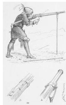
Mynd 2: Hakabyssa

fjöldaframleidda byssan var the Arquebus , eða hakabyssan eins og hún nefnist á íslensku, sem á rætur sínar að rekja til Evrópu á 15. öld. Áður en að hakabyssan steig fram á sjónarsviðið var notast við smærri útgáfu af fallbyssu sem kallaðist handfallbyss (e. handcannon) sem þótti heldur brussuleg og erfið í notkun, 2 (mynd 1) þar sem fyrst um sinn líktust hakabyssurnar fallbyssum frekar en haglabyssunum sem við þekkjum í dag. 3