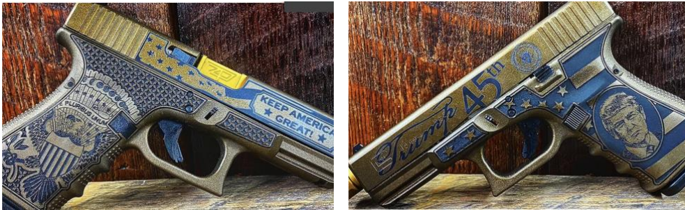
Mynd 3: Byssa framleidd og skreytt af Razorback Armory

Við, sem heimssamfélag, erum komin feyki langt frá fyrstu fjöldaframleiddu byssunni, og væri hægt að líkja magni mismunandi skotvopna við úrvalið í sælgætisverslun, hvert sem þú lítur kemur þú auga á eitthvað nýtt. Þú getur í raun og veru, ef viljinn (og peningarnir) eru við hendi, sérhannað hvernig byssu sem er. Bleik og glitrandi? Ekkert mál, mynd af fyrrum Bandaríkjaforseta Donald Trump, með slagorðunum Keep America Great ? Ekkert mál. (mynd 3)