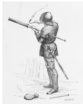
Mynd 1: Handfallbyss

Með tilkomu byssupúðurs í Evrópu fóru Evrópubúar fljótt að tileinka sér leiðir til þess að nota púðrið til vopnagerðar. Púðrið sem notast var við á tímum þessum kallaðist svartpúður, Íslendingar gegndu stærra hlutverki í framleiðslu á svartpúðri en maður myndi halda. Við framleiðslu svartpúðurs þurfti gríðarlegt magn af brennisteini og sóttu stórveldi Evrópu á þessum tíma íslenskar brennisteinsnámur til að viðhalda framleiðslunni. 1 Fyrsta