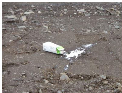
Mynd 5: Sprengd súrmjólk á Seyðisfirði

Við tökum myndir því við erum hrædd við að gleyma, sem er vafalaust hluti af okkar mannlega eðli, okkur er ekki ætlað að muna allt. Við tökum myndir af hverfandi augnablikum en náum samt aldrei að fanga raunverulegu upplifunina, en einhvern veginn skiptir það samt ekki máli. Við erum sátt með að líta til baka á myndina og endurupplifa tilfinninguna í brotabrotum. Myndirnar sem við tökum eru ákveðin framlenging af okkur sjálfum, leið fyrir umheiminn til þess að sjá það sem við sjáum, staldra við það sem maður