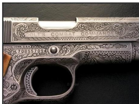
Mynd 4: Skotvopn skreytt með mynstursbökk.

Sérsniðin og skreytt skotvopn eru ekki nýtt fyrirbæri, en maðurinn hefur verið að fegra vopn í aldanna rás. Skreytingar á skotvopnum urðu gífurlega vinsælar á 16. og 17. öld þegar endurreisnin (í Evrópu) var í blússandi siglingu. Vopn voru skreytt með mikilli