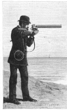
Mynd 7: Teikning af raðljósmyndabyssunni í notkun.

Þegar litið er á skotvopn og myndavélar samhliða hvoru öðru í dag er erfitt að sjá í fljótu bragði að þessir tveir hlutir eigi eitthvað sameiginlegt, en það hefur ekki alltaf verið raunin. Undir lok 19. aldar fóru myndavélabyssur að stíga fram á sjónarsviðið, útlitsleg ásýnd þeirra var á við skotvopn og var því erfitt að greina þeirra á milli.