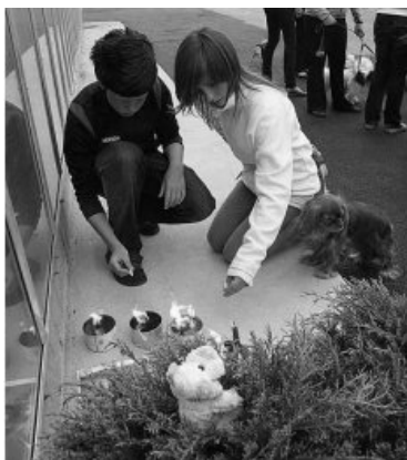
Mynd 1. Um hundrað manns tóku þátt í kertavöku á Akureyri til minningar um hundinn Lúkas, sem síðar fannst á lífi („Hundurinn Lúkas“, 2007)