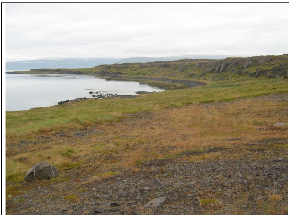
Mynd 2: Menningarlandslag. Selvík á Vatnsfjarðarnesi vestanverðu.

Þennan hátt eru þau að fólk í nútímanum getur ekki vitað hvort tóftin vestast í túninu hafði meiri þýðingu fyrir fólkið í fortíðinni en hóllinn austast í því. Þess vegna þarf að setja fornleifarnar í stærra samhengi. Það þarf að auka lýsingar á landslagi og upplifunum, reyna að ná fram samhengi og samspili náttúru, manna og dýra. Við erum öll í heiminum og erum hluti hvert af öðru; ekkert er öðru algerlega óviðkomandi. Fornleifarnar eru komnar til vegna samspils manns og náttúru. Steinarnir og torfið mynduðu húsin með hjálp mannsins hér fyrir á öldum. Dýrin og náttúran hafa líka mikið með það að gera hvernig fornleifarnar líta út í dag og maðurinn er ábyrgur fyrir því að fornleifarnar eru í náttúrunni yfir höfuð. Það þarf því að brjóta á bak aftur tvíhyggjuna, maður:náttúra, og tvinna þetta tvennt saman því það er ekki aðskilið. Auk þessa þurfa fornleifafræðingar að gera sér grein fyrir því að fornleifarnar eru aldrei staðnaðar í landslaginu heldur taka þær sífelldum breytingum. Fornleifar og landslag eru virk heild og því þarf að vinna með þær og kynna þær sem slíkar.