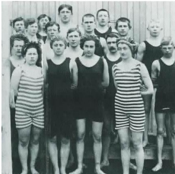
„Þessar konur ættu að fá nafn sitt letrað með gylltu letri í sögu kvenfrelsis á Íslandi.“ Vigsla sundskálans 1909.

Erlede væri karlmannleg, sem óhjákvæmilega spyrnir saman skriðsundi og karlmannlegum vexti. 179 Sund gat líka sameinast íhaldssömum hugmyndum um kvenhlutverk fyrir tilstuðlan bandaríska Hollywood-kvikmynda. Á fyrstu áratugum 20. aldar urðu sunddrottningar vinsælt viðfangsefni í bíómyndum. Þar komu þær fram í hópatriðum sem eiga meira skylt við sundballett ( synchronized swimming ) en keppnissund. Þessum atriðum fylgdi hófsamleg nekt og kynferðislegt aðdráttarafl. Sambræðingur sundkunnáttu og kynferðis gerði það að verkum að sund var sjaldan dregið í efa sem íþrótt sem gæti hentað konum. Sundkunnátta hafði þó ekki alltaf þótt eiga samleið með kvenlegum eiginleikum, þar sem ákveðin togstreita ríkti varðandi keppni. Rétt eins og fimleikarnir vann sundið sér sess sem holl afþreying en á meðan fimleikar voru viðurkenndir sem sýningaríþrótt, enda frammistaða háð dómgæslu, var keppt í sundi. Sundið er enda þannig íþrótt að árangur og framfarir eru