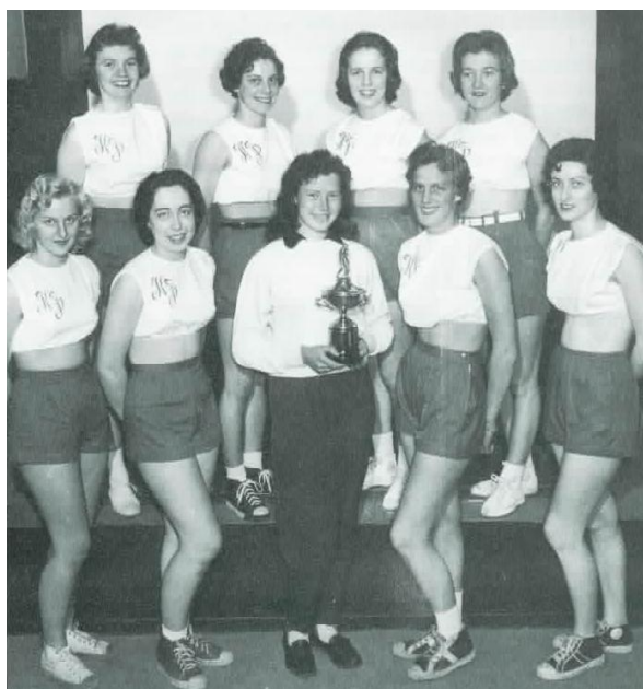
Meistaraflokkur Þróttar í handbolta 1957. Íþróttabúningar kvenna voru lengi vel hannaðir fremur til að undirstrika kynferðið en þess að vera hentugur klæðnaður fyrir hreyfingu.

varð fljótlega vinsæll leikur þeirra sem fannst fimleikarnir heldur leiðinlegir. 224 Einnig segir frá því á nokkrum stöðum að handbolta hafi verið iðkaður sem upphitun eða viðbót við fimleika. 225 Tengingar handboltans við fimleika og skólaíþróttir gerðu hann aðgengilegri fyrir konur en t.d. fótbolta. Oft er sagt frá því að handboltinn hafi fallið í grýttan jarðveg meðal formanna og þjálfara íþróttafélaganna sem töldu hann taka tíma og orku frá öðrum íþróttagreinum. Þessar frásagnir eru nokkuð merkilegar í ljósi þess að það voru ekki margar íþróttir, nema kannski hnefaleikar og þá af annarri ástæðu, sem ekki hlutu náð fyrir augum íþróttafélaganna.