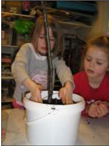
Mynd 5. Greinarnar gróðursettar

Börnin teiknuðu síðan mynd úr ferðinni. Hér koma dæmi um það sem börnin sögðu þegar þau voru spurð um myndirnar: