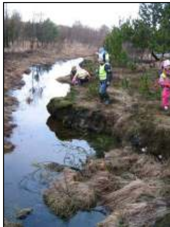
Mynd 7. Lækurinn

Þegar var komið yfir trébrúna og að krossgötunum beygðum við til vinstri. Gengið var eftir göngustíg og fljótlega komu börnin auga á spjald með fuglamyndum á. Fuglaspjaldið var skoðað og þær fuglategundir sem börnin sögðust þekkja voru ugla og hrossagaukur. Gengið var aðeins áfram þar til komið var að litlum læk og börnin fóru að stinga trjágreinum ofaní vatnið í læknum.