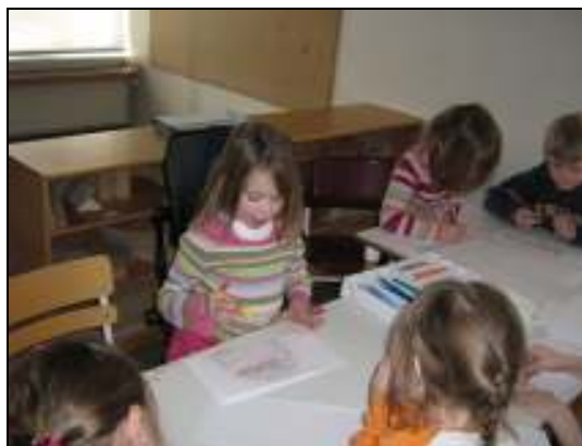
Mynd 11. Bókagerð

Börnin fengu blöð og tússliti til að gera bók. Þau fengu frjálssar hendur með hvað væri í bókunum. Flestir gerðu myndir sem tengdust verkefninu. Tvö barnanna skrifuðu „Elliðaárdalur“ á kápu bókar sinnar. Einn drengurinn bað mig að skrifa að hann væri höfundurinn. Mörg börnin skrifuðu tölustafi inn í bókina til að sýna blaðsíðutal. Börnin fengu síðan aðstoð við að skrifa texta við myndirnar sem þau gerðu í bækurnar.