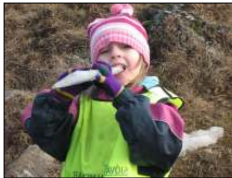
Mynd 3. Bragð

Eftir góða stund við ána var farið í svonefndan Indíanahelli að borða nesti. Þau sögðu að hann hétí Indíanahellir „af því að indíánar eiga heima hérna“. Aðspurð hvort þau héldu að einhver ætti heima í Indíanahelli svaraði ein stúlka „já, indíánar, því ég sé