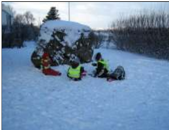
Mynd 9. Gestaboð 40 árum síðar

Öll börnin skoðuðu steininn og ein stúlkan faðmaði hann að sér. Börnin voru ekki sammála um hvort það byggju ennþá álfar í steininum eins og í sögunni þegar þau voru spurð að því. Ein stúlkan sagði að það hafi ekki búið álfar í steininum og benti á litla ljósakastara sem voru á jörðinni, og lýsti einn þeirra upp steininn. Stúlkan sagði: „ Nei, ég held að ljósið hafi gert þetta “. Þegar hún var spurð hvort það hafi verið til svona ljós í gamla daga svaraði hún neitandi. Stúlkan var spurð hvaða ljós konan í bókinni hafi séð og svaraði stúlkan á þá leið að það hafi verið vasaljós. Önnur stúlka sem var búin að skoða steininn sagði „ Ég sá silfurljós, tvö, það eru álfar inn í þessu “ og enn önnur stúlka bætti við: „ Já, ég sá það, ég sá vængi “. Þegar þau voru spurð hvort álfar hefðu vængi voru sum börnin sammála því, önnur ekki. Einn drengur sagðist hafa séð álfa heima hjá sér.