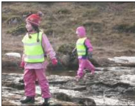
Mynd 2. Skynjun

Stúlka var að skoða eitthvað í ánni og þegar hún var spurð hvort hún hefði séð fisk svaraði hún „Já hann var svona silfur og gull“. Ein stúlka fór aðeins frá hópnum upp á hól. Aðspurð hvað hún hafi verið að gera sagði hún: „ég sá einn lítinn poll og ég varð ekkert blaut“. Einn drengur sat á árbakkanum og dinglaði fótunum. Eitt barnið sagði eftir að það var búið að henda klaka í ána: „klakinn sökk“ og gaf þá skýringu á því hvers vegna hann hafi sokkið: „af því ég henti honum ótrúlega langt“.