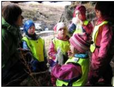
Mynd 4. Í indíánahelli

Þegar börnin voru búin með nestið og skoða sig um fengu þau plastpoka til að safna í einhverju áhugaverðu sem þau fyndu. Nokkur þeirra voru þegar komin með eitthvað í hendina, svo sem trjágreinir, strá og steina.