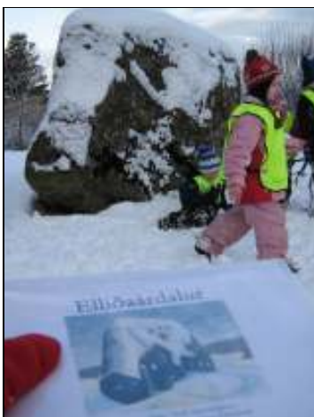
Mynd 8. Steininn og bókin

Við leikskólann er steinn og voru börnin spurð hvort þetta gæti verið steinninn. Þau svöruðu neitandi. Þau voru þá spurð hvort þetta gæti verið álfasteinn og svöruðu þau því neitandi því hann væri of lítill. Þau voru spurð að því sama varðandi annan stein sem hópurinn rakst á á leiðinni, en þau sögðu að hann gæti ekki verið álfasteinninn, því það væri ekkert hús við hliðina á honum. Á leiðinni sagði ein stúlkan að hópurinn hefði ekki farið niður í Elliðaárdal þegar það væri snjór, en í þessari ferð var fyrsta sinn snjór yfir öllu.