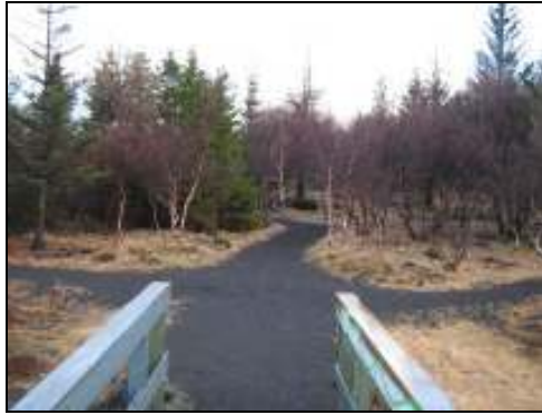
Mynd 1. Krossgötur

Þessi leið var nokkuð brött yfirferðar og grýtt. Öll börnin sýndu áhuga á að vaða í ánni. Sum náðu í steina og klaka til að kasta í ána og sum smökkuðu á klakanum. Önnur fundu trjágreinir og fóru að dýfa þeim í ána. Ein stúlka sagði eftir að hafa dýft höndunum ofan í vatnið „ég snerti fossinn með höndunum“. Önnur stúlka stóð á stórum steini, hélt jafnvægi og kallaði: „sjáðu mig“ og ég svaraði henni: „þú ert dugleg að halda jafnvægi“.