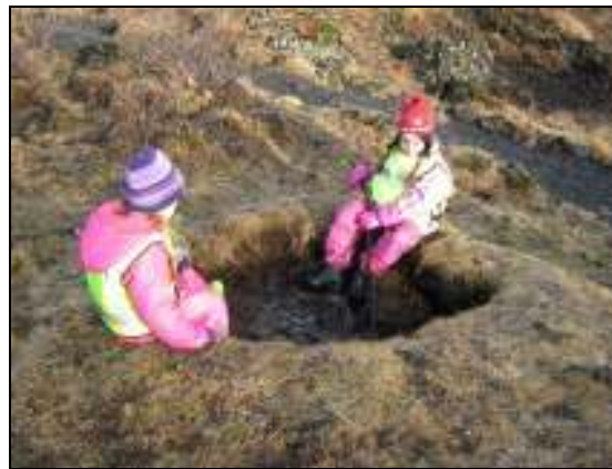
Mynd 6. Veiðimenn

Þegar hópurinn var kominn yfir trébrúna að krossgötunum var haldið beint áfram. Komið var að trjából sem búið var að saga. Ein stúlkan sagði stolt á svipinn: „ Þetta tré sagaði pabbi minn “. Rætt var um af hverju væri verið að grisja skóginn og fram kom ein tilgáta: „ svo hin trén fái pláss “. Einnig sáu börnin skýli sem gert var úr trjágreinum sem hafði verið raðað saman og sögðu börnin að þetta væru indíánahús. Síðan var komið að opnu svæði með bekkjum, brekku og stíg upp hæðina. Þarna skapaðist mikill leikur hjá börnunum. Þau fóru í hlutverkaleiki, ein stúlkan fann t.d. trjágrein og fór að veiða. Nokkur börn renndu sér niður brekkuna. Einn drengurinn sagði eftir að hafa horft í kringum sig: „ Ég sé ekkert eins og í gamla daga “.