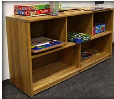
Bandarísk framleiðsla mynd 5.