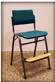
Kid Chair mynd 9.

Á Íslandi er ekki mjög stór markaður fyrir leikskólahúsgögn og því kannski eðlilegt að ekki séu margir framleiðendur né seljendur hér á landi. Draga má þá ályktun að flest leikskólahúsgögn á Íslandi séu frá Á. Guðmundssyni, enda hafa þeir verið hvað lengst í bransanum. 32 Barnasmiðjan hefur í gegnum tíðina framleitt eitthvað af leikskólahúsgögnum meðfram framleiðslu á útileiktækjum en snéri sér alfarið að smíði útileiktækja fyrir nokkrum árum. 33 Í góðærinu flutti Penninn inn mikið af skólahúsgögnum og fór eitthvað af þeim inn í leikskóla. 34 Önnur fyrirtæki hafa einnig verið að smíða og flytja inn leikskólahúsgögn en ég ákvað að tala við þessi þrjú sem nefnd eru og grennslast fyrir um leikskólahúsgögn.