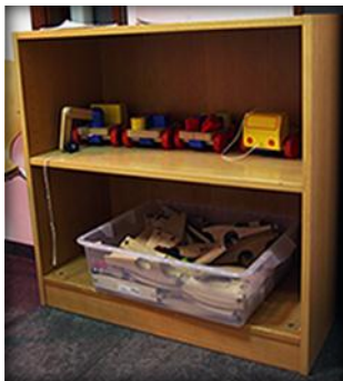
Íslensk framleiðsla mynd 4.

Þetta er fyrsti leikskólinn á landinu þar sem ljósaver er í boði. Þarna inni eru myndvarpar, ýmiskonar ljósabúnaður, speglar, seglar og skuggaleikhús sem er mjög vinsælt hjá börnunum. 24 Ég hugsaði með mér að það hefði nú ekki verið leiðinlegt að fá að leika sér þarna þegar maður var yngri. Einnig sýndi hún mér þunglamalegar hillur sem fylgdu húsnæðinu og muninn á þeim og hillum sem hún keypti notaðar af gömlum leikskóla. Þær hillur eru framleiddar af bandaríska ríkinu og finnst henni stærð þeirra passleg. Þær eru á hjólum og oft notaðar til að búa til rými inn í rými, hillurnar eru ekki mjög háar og því auðvelt fyrir börnin að sjá í kringum sig. Efniviðurinn í hillunum er fura, sem gerir það að verkum að hljóðið skellur öðruvísi á þeim heldur en hillunum sem fylgdu. Þær eru smíðaðar af Á. Guðmundssyni og greinilega hannaðar með skrifstofur í huga en ekki inn á leikskóla þar sem stærðarhlutföll eru allt önnur.