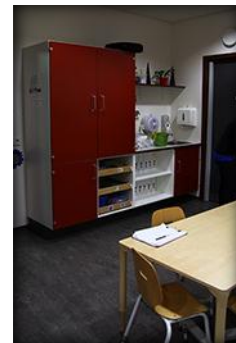
Rými mynd 6.