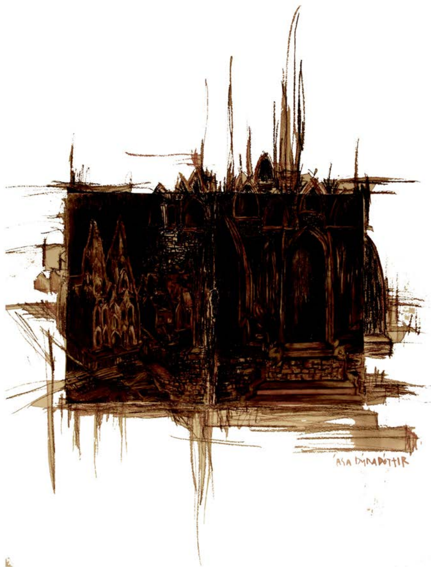
Ása Dýradóttir. Köln . 2010