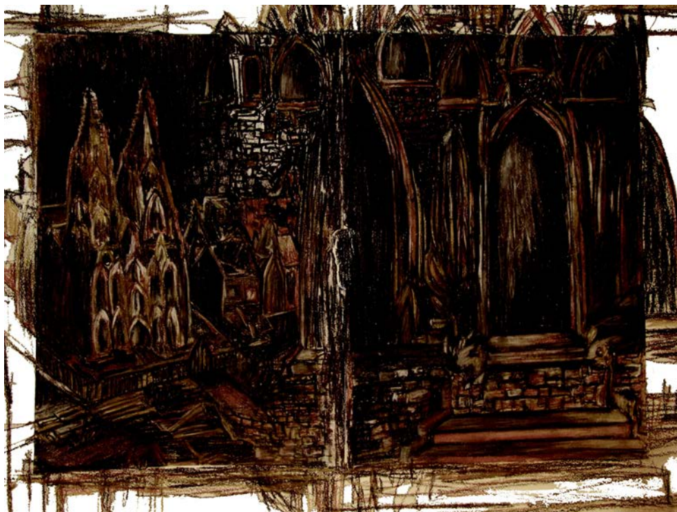
Ása Dýradóttir. Köln . 2010 – nærmynd